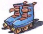
Utiliser ses rollers