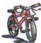
Utiliser son vélo