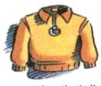
Besoin de s'habiller