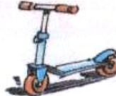
Utiliser sa trottinette