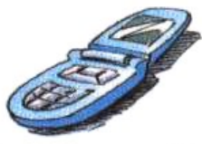
Besoin de communiquer