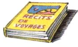
Besoin de s'instruire