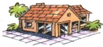
Besoin de se loger