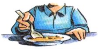
Besoin de s'alimenter