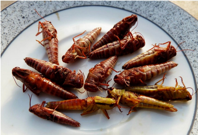
Plat de criquets

Activité 4 : Je lis le texte et réponds aux questions situées ci-dessous.