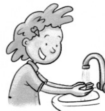
wenn möglich Hände waschen oder desinfizieren