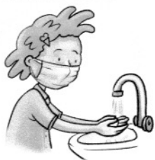
wenn möglich Hände waschen oder desinfizieren