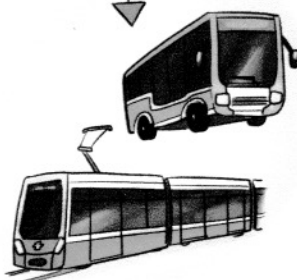
in öffentlichen Verkehrsmitteln