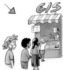
wenn Abstand halten schwer ist