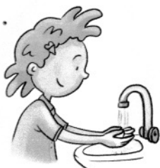
wenn möglich Hände waschen oder desinfizieren