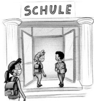
beim Betreten der Schule