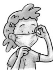
über Nase, Mund und Kinn ziehen