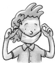
an den Gummibändern abnehmen