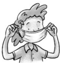
verstärkter Teil ist oben, Gummibänder über die Ohren geben