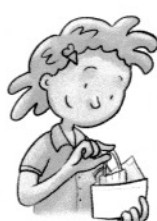
in einen sauberen Umschlag geben