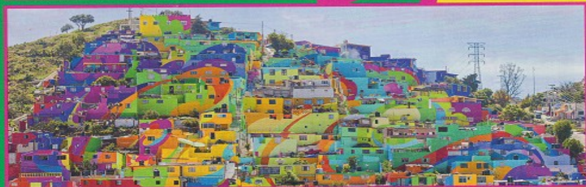
El macromural del barrio de Las Palmitas, en Pachuca, Estado de Hidalgo (México).

Mundo 28 de julio de 2015 - por Mari T. Rosas