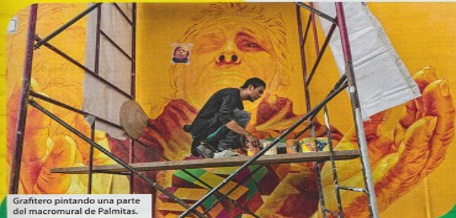
Graftero pintando una parte del macromural de Palmitas.