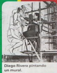
Diego Rivera pintando un mural.

3. Lee el texto La Historia de México y di lo que sabes del artista Diego Rivera, de su obra y del movimiento pictórico que representa.