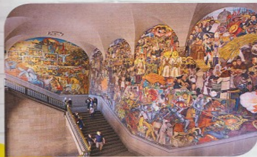
Diego Rivera (pintor mexicano), La Historia de México, 1939 (Palacio Nacional de México D.F.).

1. las paredes: les murs - 2. a principios del siglo XX